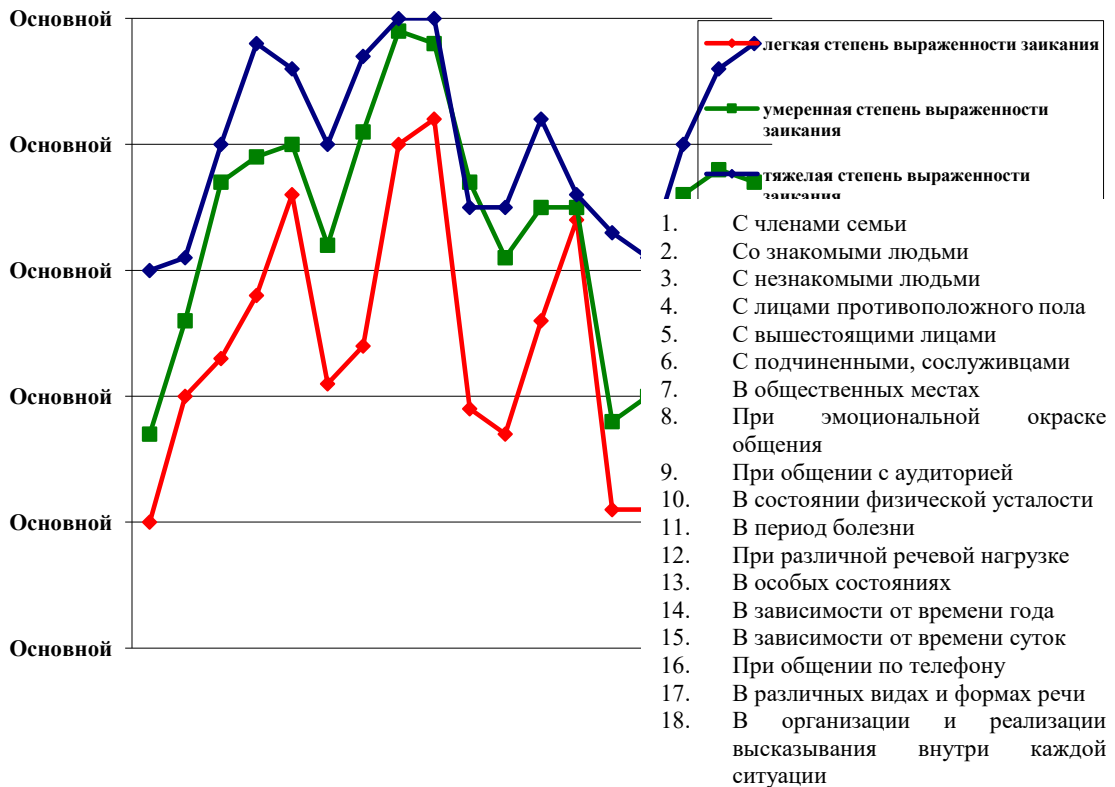
Рисунок 3. Средние показатели выраженности заикания в ситуациях социального взаимодействия у пациентов с разной степенью выраженности заикания

Анализ полученных результатов позволил определить общие закономерности взаимосвязи логофобии, скоптофобии, проявления речевых дефектов и ситуаций социального взаимодействия (например, уменьшение их выраженности при снижении эмоциональной и речевой нагрузки в условиях коммуникации с близкими людьми, членами семьи, знакомыми, в период заболеваний и т.д.), а также специфические аспекты логофобии и скоптофобии в разных социальных и коммуникативных ситуациях. Результаты проведенного логопедического обследования участников исследования в дальнейшем были сопоставлены с субъективными особенностями их коммуникативной, эмоциональной, личностной и социальной сфер [18].