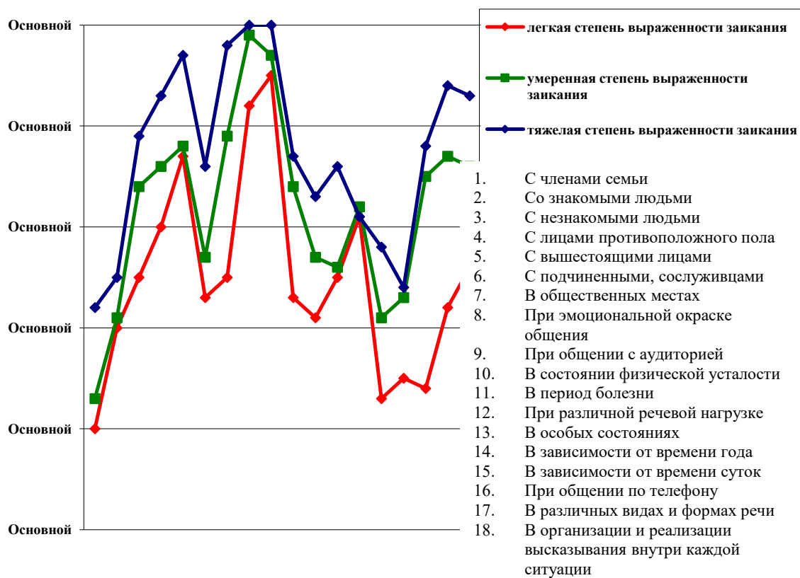
Рисунок 2. Средние показатели выраженности страха речи в различных коммуникативных ситуациях у пациентов с разной степенью выраженности заикания

Анализ результатов логопедического обследования позволил констатировать, что речевая симптоматика у всех участников достаточно вариативна как по сочетанности речевых дефектов, так и по их степени выраженности, что следует в обязательном порядке учитывать при планировании, организации и реализации комплексной коррекционной работы с ними [17].